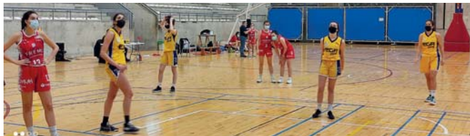
Los primeros meses tras la suspensión, los partidos se disputaban con mascarilla

taban a Navarra los equipos de Aranguren Mutilbasket, Navarro Villoslada Basket Navarra y Megacalzado Ardoi. Y otros cuatro jugaron en segunda división femenina: San Ignacio, Navasket, Kaleangora Liceo Monjardín y Lagunak Furgovip. En primera masculina, una mala primera fase de la competición condenó a Aranguren Mutilbasket al grupo Copa Federación, en el que no logró sumar ninguna victoria.