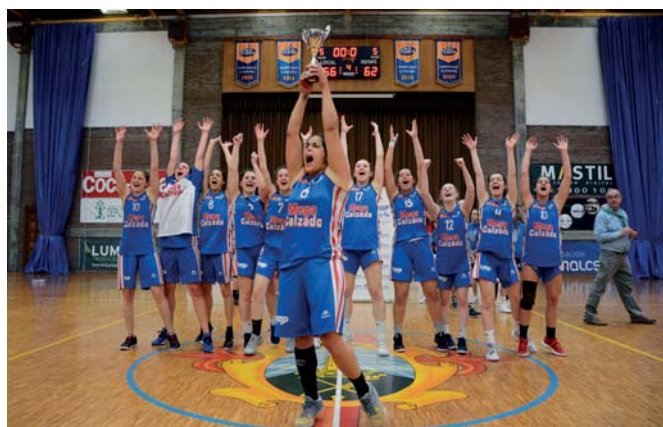
Megacalzado Aritzi celebrando el ascenso a Liga Femenina 2

El baloncesto navarro II. Historia de un proyecto compartido