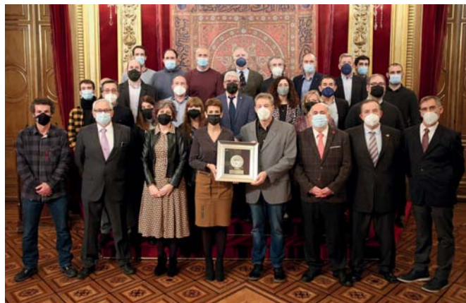
La familia del baloncesto navarro, recibida por el Gobierno de Navarra