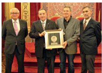
Los cuatro últimos presidentes en la recepción del Gobierno de Navarra 6 días más tarde. Ya en 2022, la fiesta del Arena Basket del 4 y 5 de febrero, el foro de expresidentes del 9 de marzo, la gala y exposición fotográfica del 75 aniversario en mayo en Burlada, el Plaza 3x3 Caixabank y el partido de selección española masculina de agosto.

La temporada finalizó con números muy cercanos a los que se daban antes del ataque de la Covid-19: 6.686 licencias, 471 equipos, 45 clubes y 950.000 euros de presupuesto.