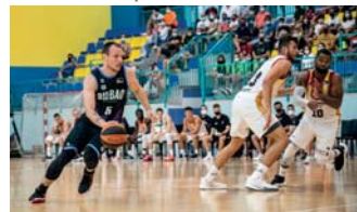
Partido amistoso ACB entre Bilbao Basket y Casademont Zaragoza en Sarriguren