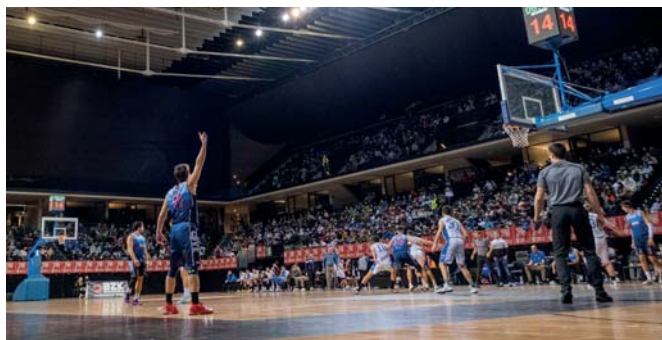
Derby navarro de Liga EBA entre Valle de Egüés y Megacalzado Ardoi en el marco del Arena Basket El baloncesto navarro II. Historia de un proyecto compartido