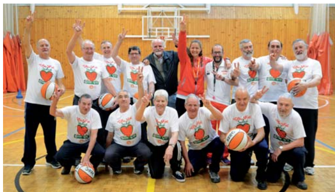
Participantes en el programa "Que basket, salud"