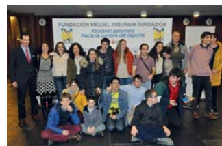
El programa de psicobasket de Aritzi, premiado por el Gobierno de Navarra

El baloncesto navarro II. Historia de un proyecto compartido