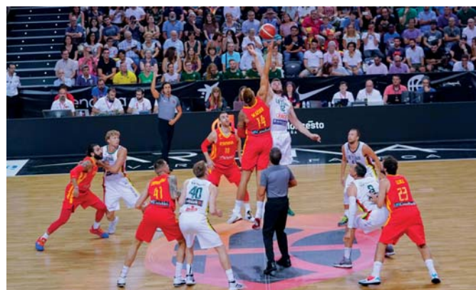
La selección regresó a Navarra después de 23 años y llenó el Navarra Arena

En lo que fue un partido histórico, la selección española masculina volvía a Navarra 23 años después de su última presencia. La expectación que levantó el primer encuentro de la gira preparatoria para disputar el Mundial de Pekín hizo que las 10.000 entradas se vendieran en un solo día. Antes del choque del 2 de agosto de 2019, Jorge Garbajosa, presidente de la federación española aseguraba que "la presencia de la selección en Pamplona es el fruto del trabajo de la Federación Navarra de Baloncesto, que hace una gran labor para promocionar nuestro deporte". Aunque el resultado fue lo de menos, España superó a su rival Lituania por un 78-70. Para los de Scariolo supuso un primer paso adelante con tan buenas sensaciones que mes y medio después, el 15 de septiembre, se hacían con el oro del Mundial de baloncesto tras derrotar a Argentina por un contundente 95 a 75.