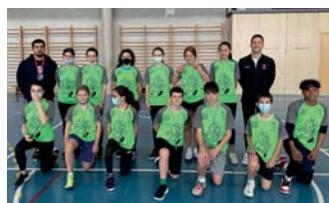
Campus JAPB orientado al arbitraje participativo

en Baloncesto, los cursos de iniciación, la formación continua, el campus de entrenadores y el 'clínic' FNB.