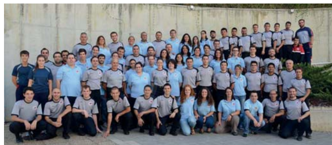
Árbitros, miembros de la escuela y oficiales de mesa de la temporada 2015/16