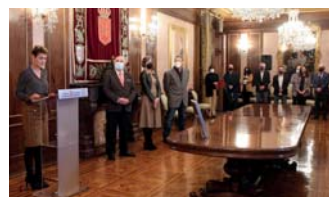
María Chivite durante su intervención