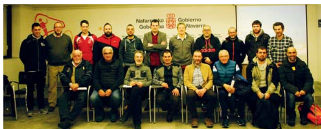
Federación, INDJ, Fundación Miguel Induráin y clubes, reunidos para estructurar el baloncesto femenino en el marco del proyecto "Hacia la cima del deporte"

Como novedad, y con el objetivo de garantizar que el respeto y la deportividad estén presentes en los encuentros deportivos, en los Juegos Deportivos de Navarra se creó la figura del "delegado de valores en el terreno de juego", con funciones