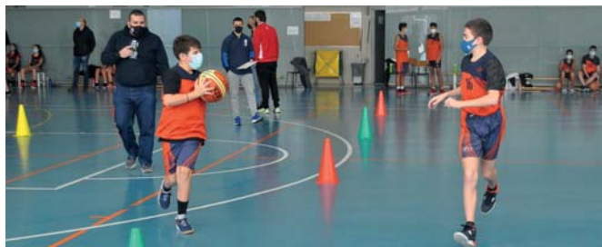
Programa "Skills Challenge" puesto en marcha por la FNB como alternativa a la práctica del baloncesto durante la pandemia El baloncesto navarro II. Historia de un proyecto compartido

Después de una larga travesía por el desierto de la pandemia, con numerosas normativas sucesivas que iban aplazando la