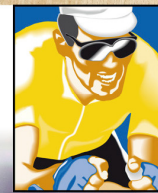
FUNDICIÓN MIGUEL INDURAIN FUNDACIÓN

ESCUELA NAVARRA DEL DEPORTE NAFARROAKO KIROL ESKOLA