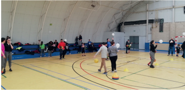
Participación de padres y madres.